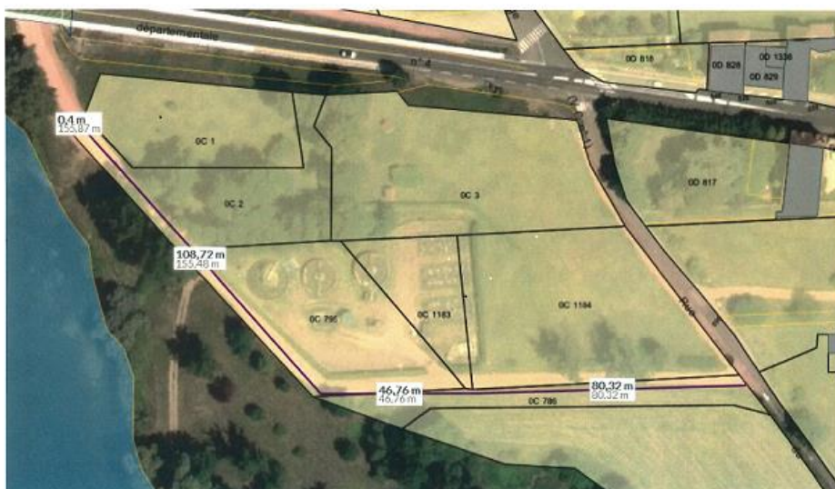
Station d'épuration : 80 chemin des Cabanes Le chemin dans sa totalité mesure de la rue du Port à la limite de propriété avec le domaine fluvial 236 m environ.

Monsieur le Maire propose de le nommer « chemin des cabanes ».